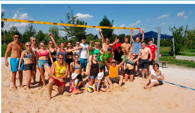
Zum gemeinsamen Gruppenbild stellten sich alle Teilnehmer gut gelaunt gerne dem Fotografen