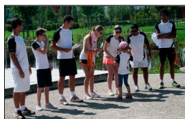
VfB Tennis-Damenteam Ü50