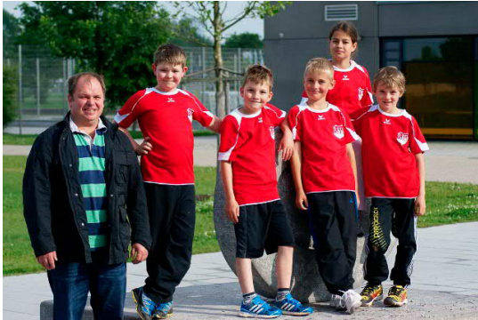
(Text/Bild Anika Hewelt/Helmut Kratzer)

Die Tennisjugend bedankt sich herzlich bei Ihrem Hauptsponsor H+S Fliesenleger und den weiteren Unterstützern Apotheke am Bach und dem Goldach Markt.