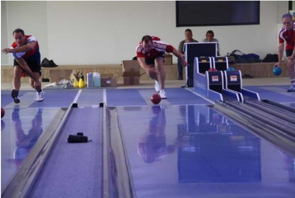
Hoch motiviert wurde die neue Kegelbahn ausprobiert