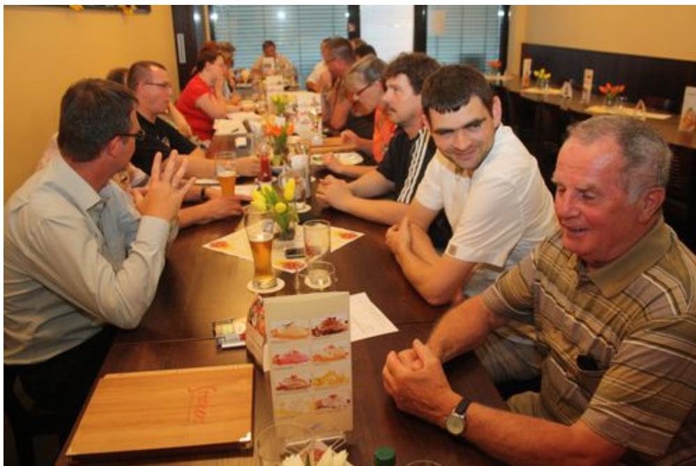
Rund 20 Mitglieder der Kegelabteilung verfolgten die Jahreshauptversammlung