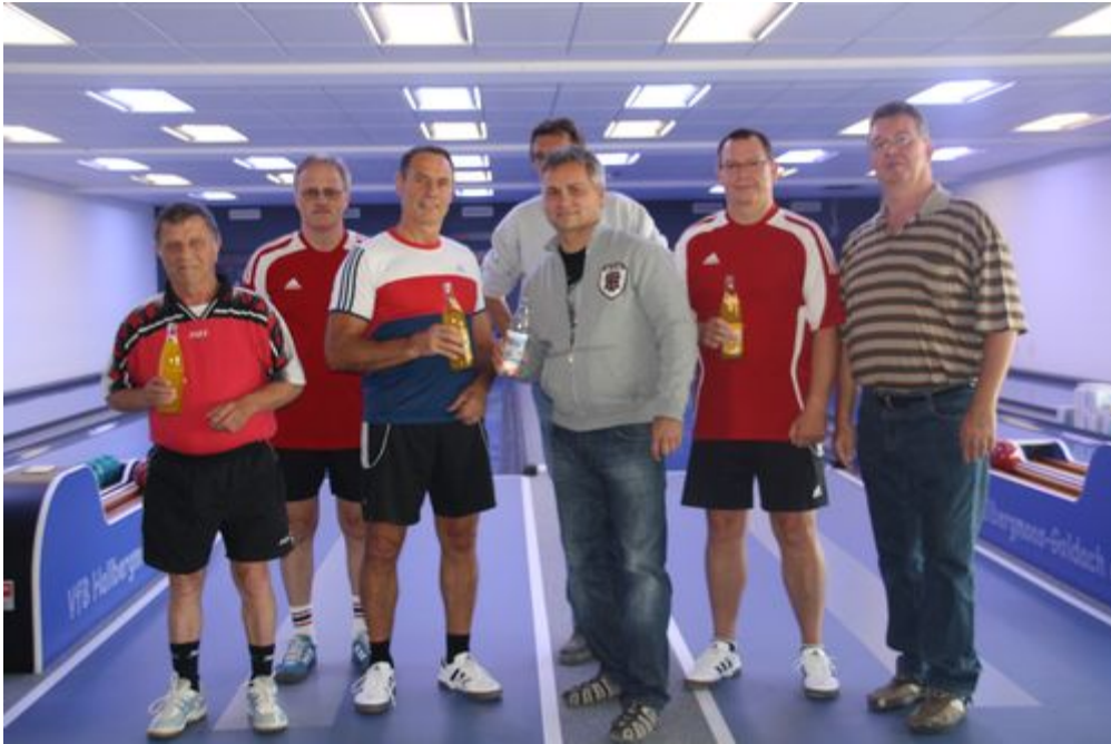
Mit dem neuen Wirt und den Kegelbahnbauern wurden auf die neuen Kegelbahnen angestoßen

(Text und Bilder: Christiane Oldenburg-Balden)