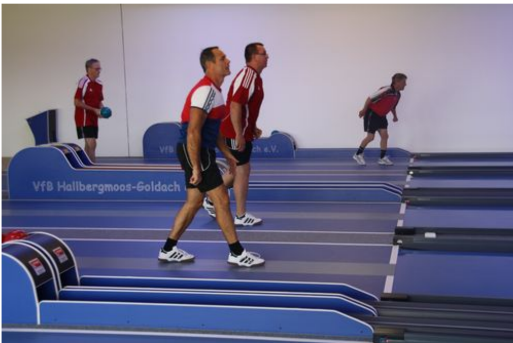
Kritische Blicke zur futuristischen Anzeigentafel