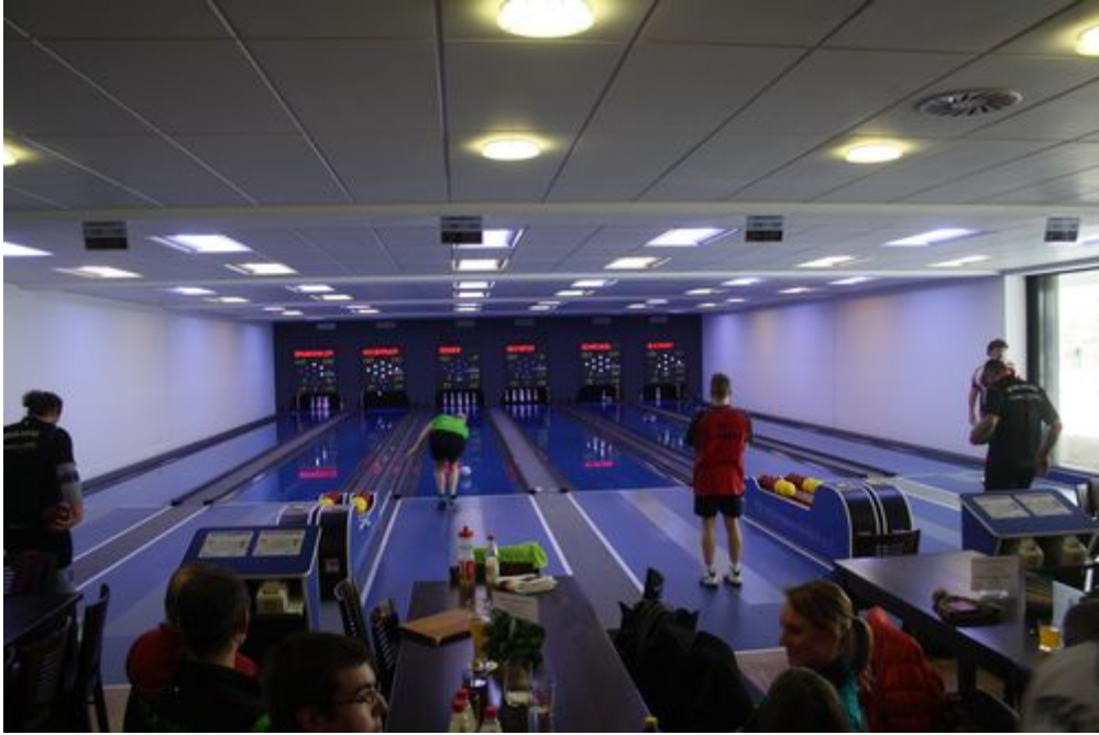
Auf der Kegelbahn wurden am Samstag 26. Januar die Kreismeisterschaften der Männer unter 50 ausgetragen