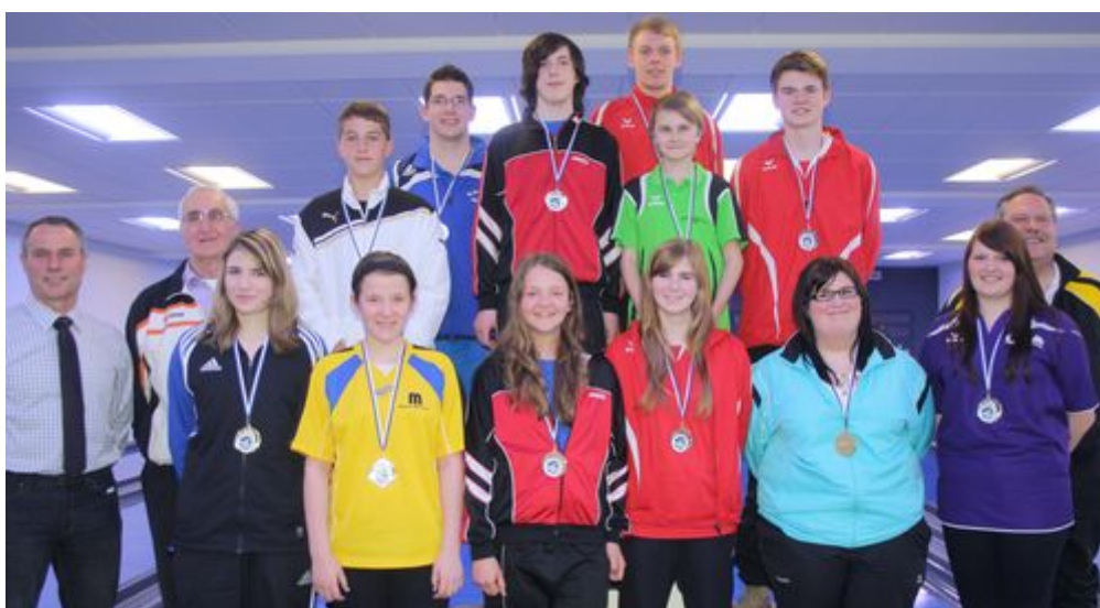
Die Erstplatzierten der Bezirksmeisterschaften mit den Offiziellen