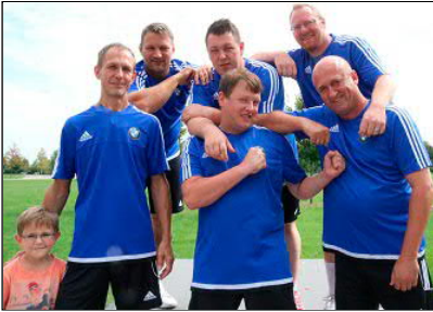
Gutgelaunt präsentierten sich die Vertreter von Bayernligist BMW Landshut und wollten gegen die Damen zeigen was sie können