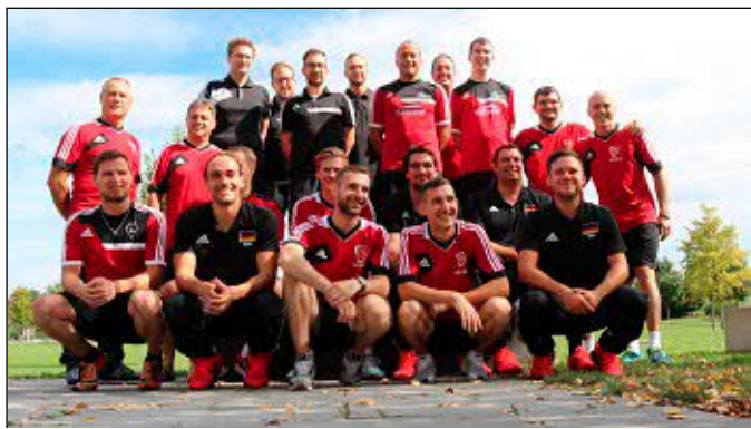
Die Bundesligisten mit Regionalligist VfB auf einem Bild vereint

{eventgallery event='HallbergmastersKegeln3.9.2016' attr=images mode=tiles max_images=6 thumb_width=65 offset=6 }