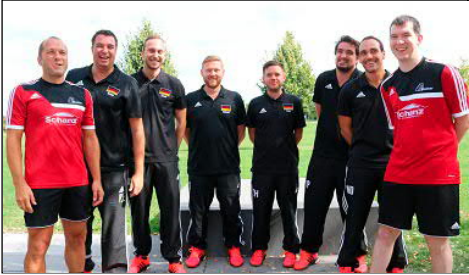
Schwabsberg war heuer zweiter in der Europoliga