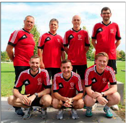
Der VfB stellte ein Team aus Spielern der 1. und 2. Mannschaft