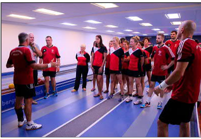
Eine kurze Ansprache gab es vorm Start des Wettkampfes