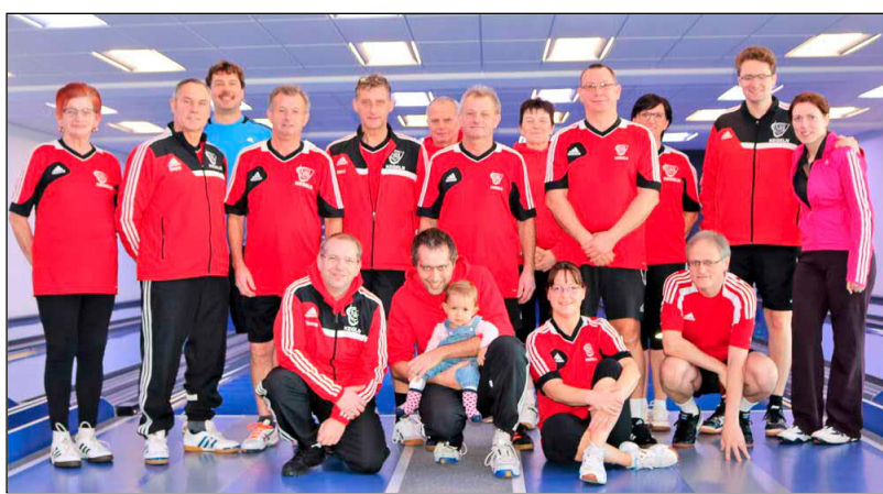
Alle Teilnehmer des Anna-Tetzlaff-Turniers

Wie auch in den letzten Jahren fand auch heuer am Drei-Königstag das Anna-Tetzlaff-Turnier der Kegler statt. Während der kleinen Winterpause nutzen die Kegler gerne dieses Turnier um sich wieder auf die Fortsetzung der Saison vor zu bereiten. Aber dennoch steht der Spaß im Vordergrund. Aus den anwesenden Spielern und Spielrinnen wurden 9 Teams ausgelost und an den Reaktionen der Spieler und Mitspieler konnte man vermeintliche Favoriten schon benennen.