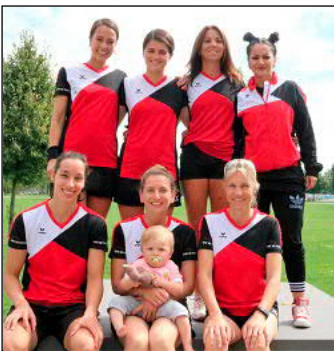
Eindeutig das attraktivste Team des Turniers