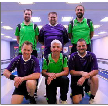
Die Spieler von Oberlauterbach bestachen mit ihrem Farbmix aus grün und lila