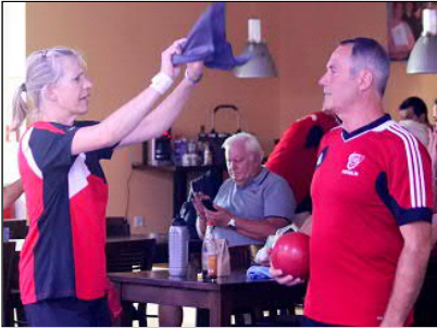
Handtuchfecheln für ein kühles Lüftchen