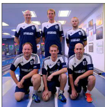
Man kennt sich gut: Die Gäste des SKC Altschaching Deggendorf