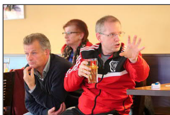
Gespannt verfolgten einige VfB'ler die Partie