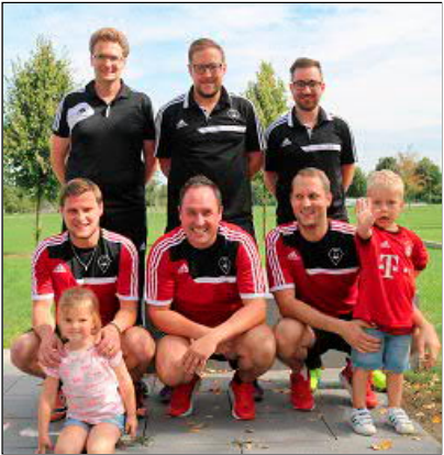
"Besonders alle Mamis grüßen"