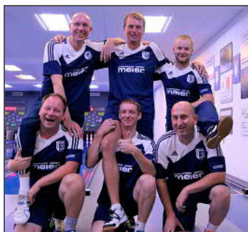
Die Deggendorfer unterstützen sich gerne gegenseitig und verleihen auch ein drittes Bein