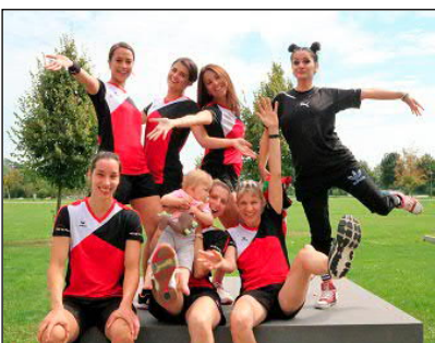
Die gutgelaunten Damen des Bundesligisten Poing