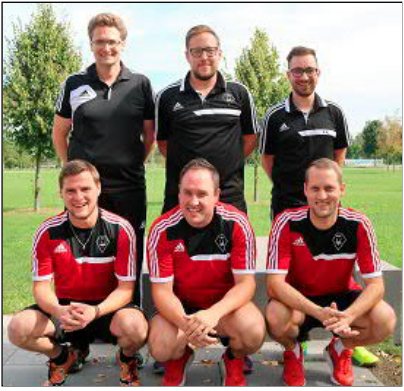
Die Spieler des Bundesligisten Kipfenberg wollten von Hallbergmoos aus