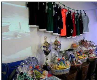
Viele attraktive Preise warteten auf die besten Kegler