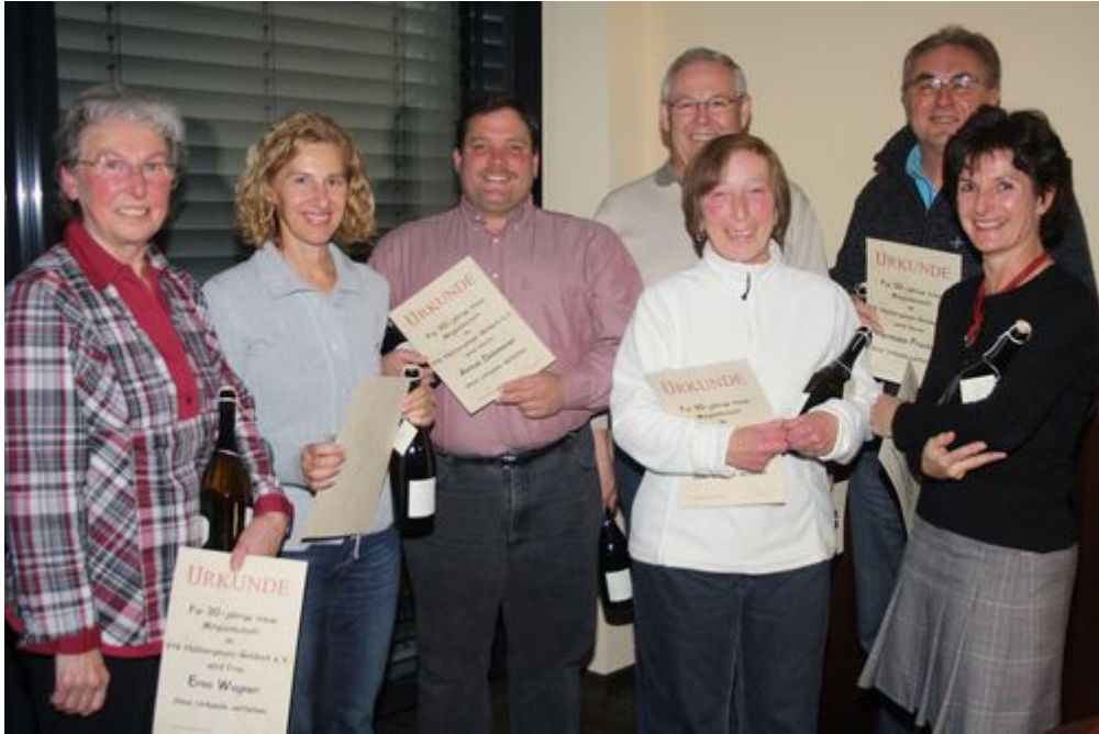
30 Jahre Mitglieder