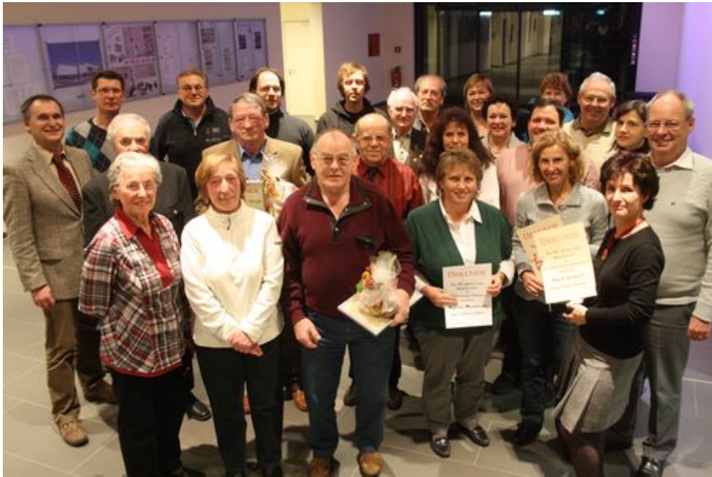
Alle 21 anwesenden Geehrten versammelten sich mit der Vereinsvertretung zum großen Gruppenbild