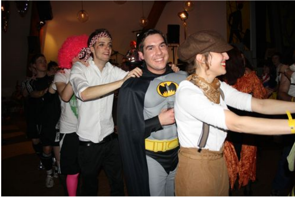
(Text und Bild: Christiane Oldenburg-Balden)