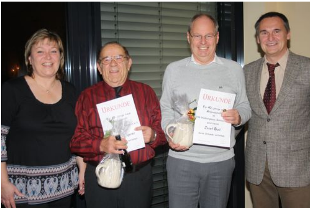
40 Jahre dem VfB treu