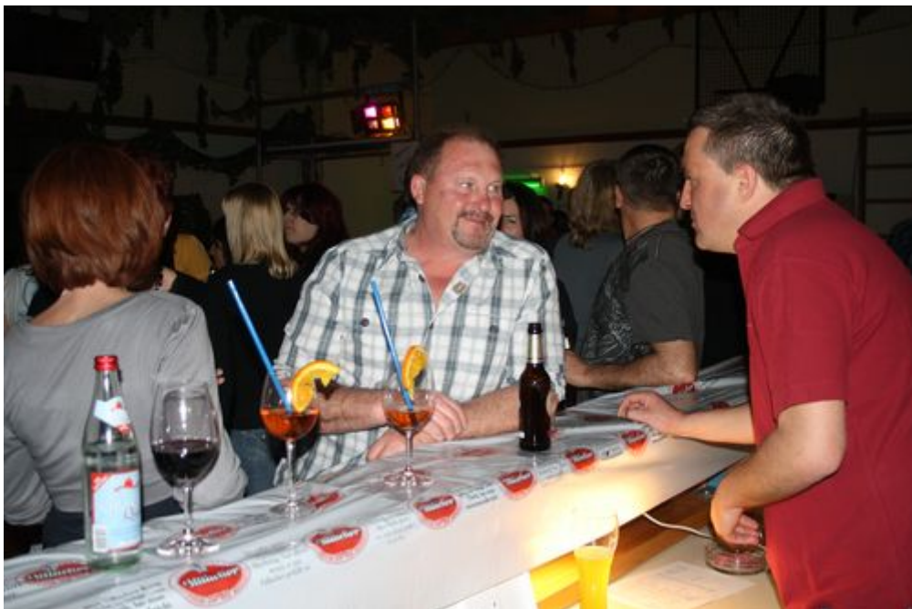
Leckere Cocktails und freundliche Bedienung hinter der Theke lockten an die Bar

Von wegen Ü30: Ein Teil der A-Jugend Spieler mit ihrem Trainer und einem AH-Spieler