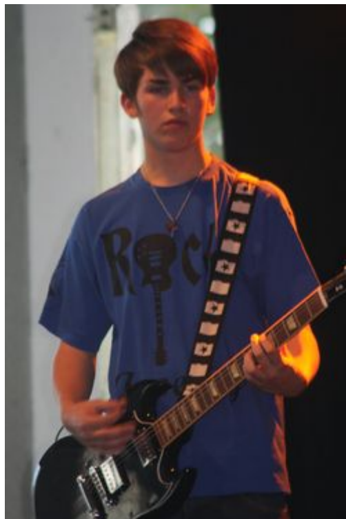
(Bilder und Tex: Christiane Oldenbrug-Balden)