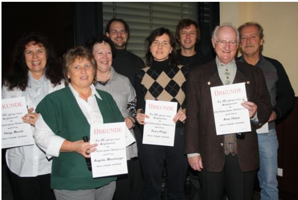
25 Jahre beim Verein