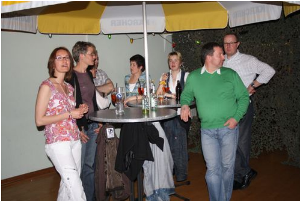
Wer nicht tanzte unterhielt sich gemütlich