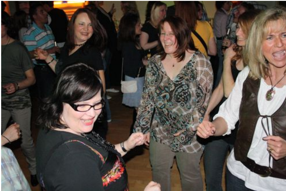
Beherrschen die Tanzfläche: Die holde Weiblichkeit