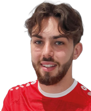
23 Aldin Bajramovic