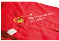
VfB Fleece Decke 29,95 €