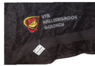
VfB Badetuch schwarz 24,95 €