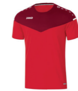
JAKO T-Shirt - Artikel 6120 Farbe 01 ab 28,99 € Optionen verfügbar