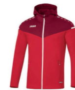
JAKO Kapuzenjacke - Artikel 6820 Farbe 01 ab 49,99 € Optionen verfügbar