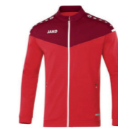
JAKO Polyesterjacke - Artikel 9320 Farbe 01 ab 49,99 € Optionen verfügbar