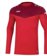
JAKO Sweat - Artikel 8820 Farbe 01 ab 37,99 € Optionen verfügbar