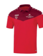
JAKO Polo - Artikel 6320 Farbe 01 ab 34,99 € Optionen verfügbar