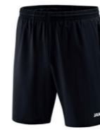
JAKO Short Profi - Artikel 6208 Farbe 08 ab 22,99 € Optionen verfügbar